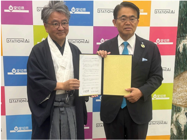
大村秀章愛知県知事と中村伊知哉 iU 学長

iU（情報経営イノベーション専門職大学、東京都墨田区、学長：中村伊知哉、 https://www.i-u.ac.jp/ ）は、愛知県（愛知県名古屋市 知事 大村秀章、 https://www.pref.aichi.jp/ ）とスタートアップ・エコシステム形成に関する連携協定を締結し、2025 年 5 月 27 日連携協定調印式を愛知県庁（公館）にて執り行いました。